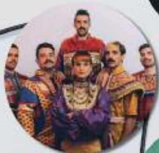
Deluxe + Daysy (6e partie) Sam. 7 mars