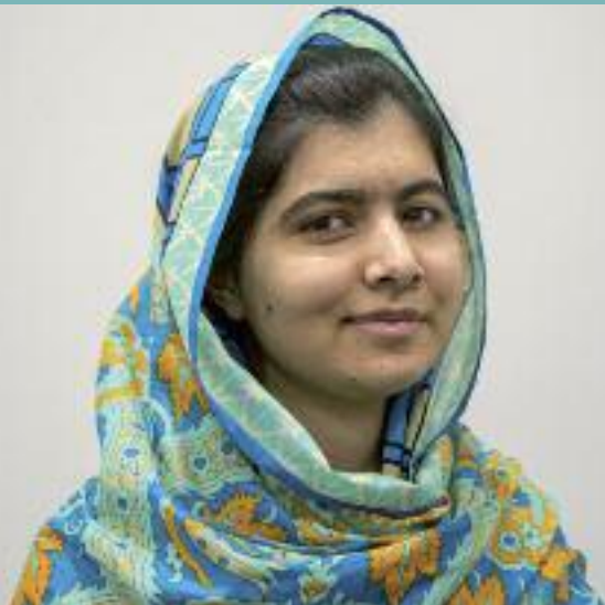
Malala Yousafzai a reçu le Prix Nobel de la paix en 2014 à l'âge de 17 ans.