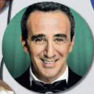
Elie Semoun Ven. 2 avril