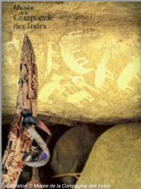
Illustration © Musée de la Compagnie des Indes